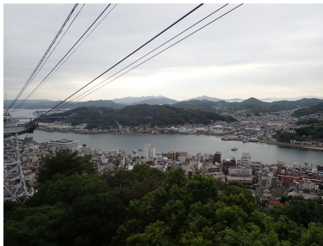
ロープウェイからの景色

の奥座敷にある今晚の宿の尾道ふれあいの里へむかいました。夜は季節の懐石を楽しみ温泉に入りゆくりと過ごしました。