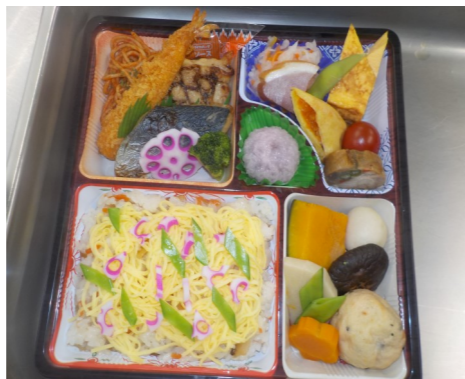
特製弁当(ちらし寿司)1200円(税込み)

ついで厨房内の動線効率も向上しま した。これからもより多くのお客様 に、見た目も味もおいしいお 弁当をお届けしていきたいと思 います。