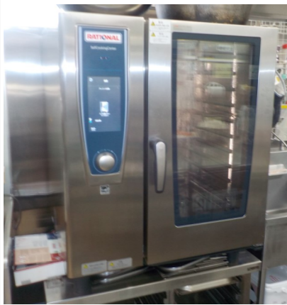
ドイツ製 新スチムコンベクション

厨房のスチムコンベクションが 新しくなりました。スチムコンベ クションとは、一度に大量調理でき るオーブンのことで、お弁当づくり には欠かせません。新しく届いたス チムコンベクションはドイツ製の 最新式のもので、これまでのものと 違って内部のセンサーが自動的に水 分量や温度測定をして、食材の油分 を使って表面はカリッと中はふっく らと、一番おいしい状態で焼き上げ てくれます。手作業で入れ替えてい た焼きむらもなく、自動洗浄機能も