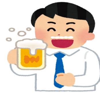
甘いあま〜いバタービール

準備の甲斐もあり行きバスの中からとても盛り上がり、わくわく！した旅行気分も上がります。今年の大阪旅行の目玉といえ