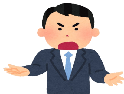
集会でのお父さんの訴え

当日は320名以上の方が裁判所に集まりました。5倍という高倍率でしたが奇跡的に抽選に当たり、傍聴することができました。